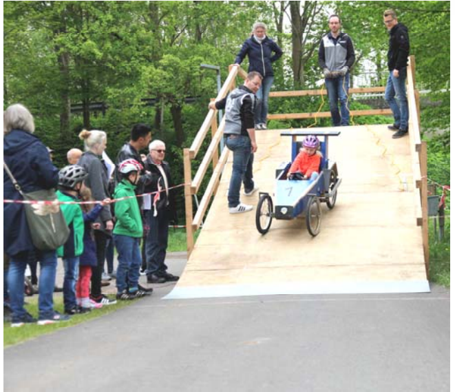
Schützenfest 2018 - High Speed in Leuchtenburg