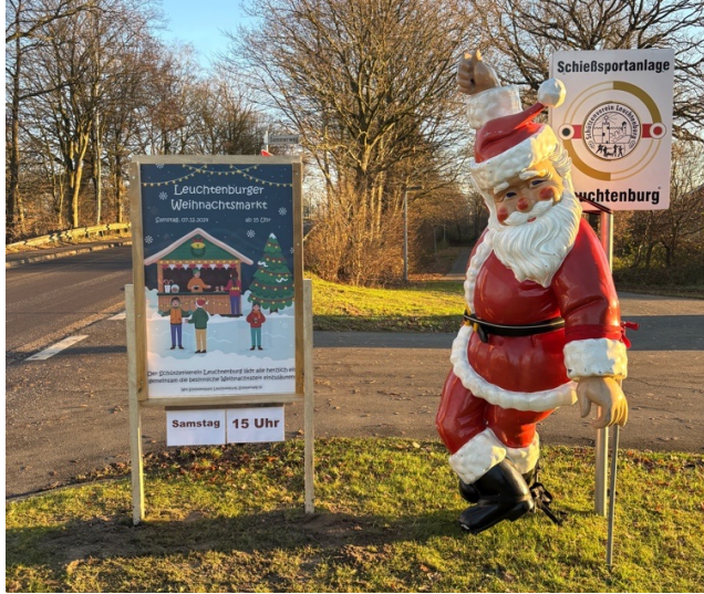
Weihnachtsmarkt in Leuchtenburg