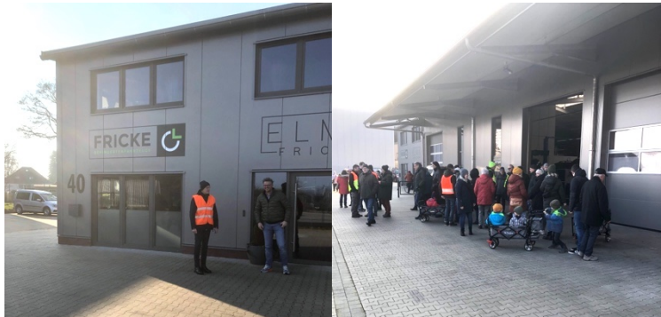
Beim Kohlgang zu Besuch bei Firma Fricke