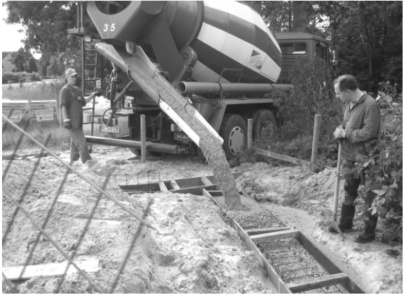
2. Bauabschnitt, . . . die Mischung stimmt