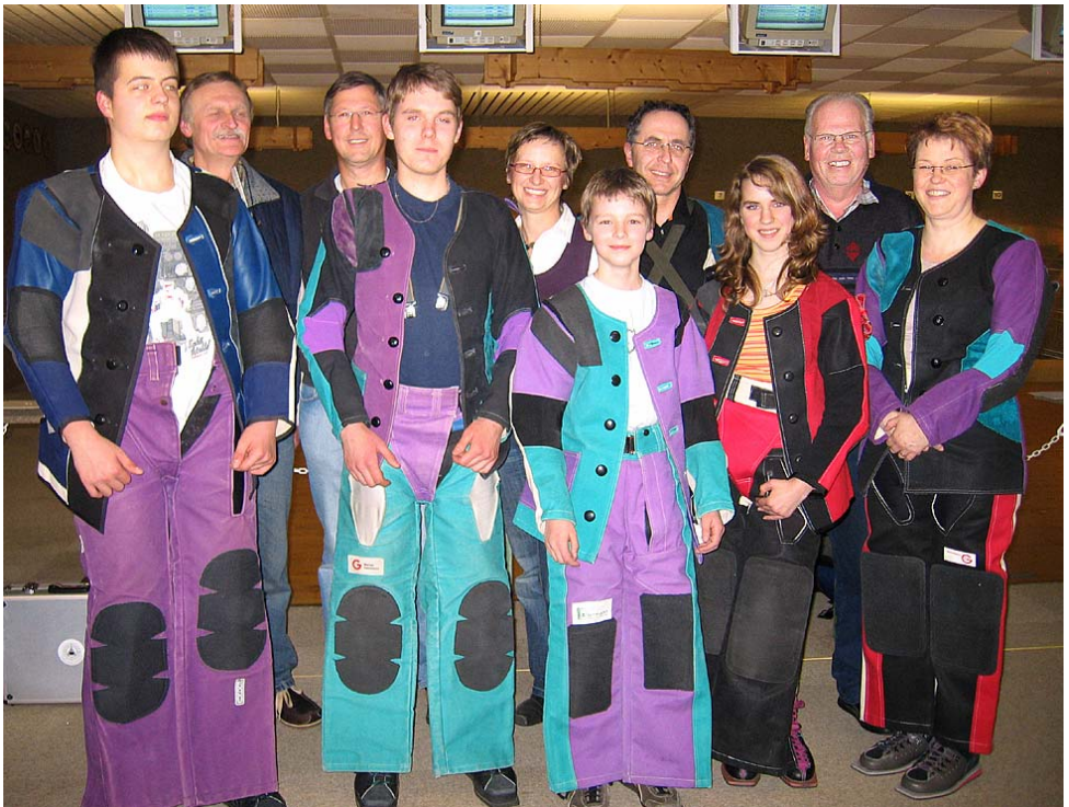
Die Finalisten 2008 des Wettbewerbs „Jung und Alt im Dialog“