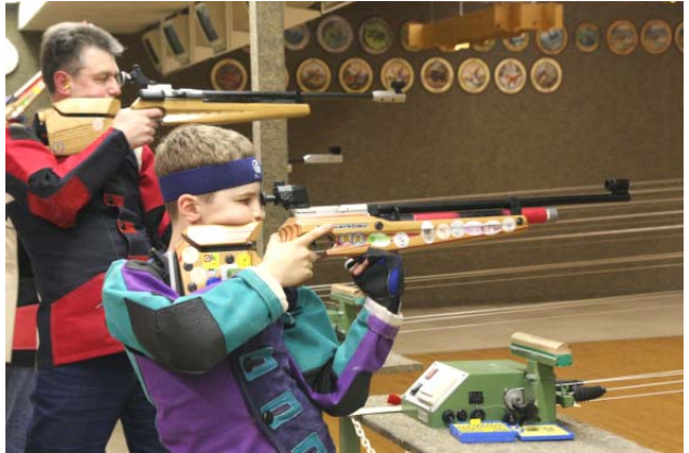
Pokalfinale: alt und jung im Dialog