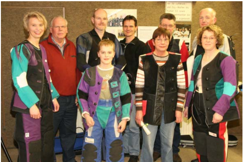
Die Teilnehmer am Finale der Leuchtenburger Pokalrunde

Im ko-System ging es in den nächsten drei Wochen weiter, bis sich jetzt jeweiligen 5 Teilnehmer für das Finale der Haupt- und Trostrunde qualifiziert hatten. Nach dem Vorkampf über 20 Schuss kam es dann zu den 10 Finalschüssen, welche jeweils innerhalb von 75 Sekunden abgegeben werden