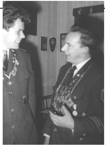
1964 – Jüngster Schützenkönig mit 21 J.