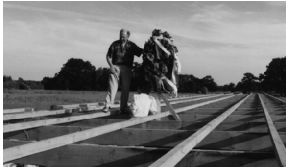
1992 – Richtkrone auf dem KK-Stand