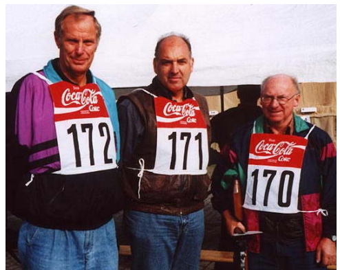
2002 – Biathlon, so sehen Sieger aus