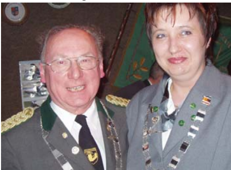
2004 – König Gerd mit Königin Petra