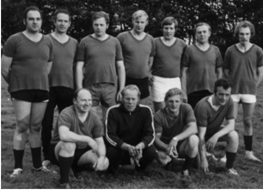
1974 – Fit durch Fußball