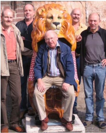
2006 – Bildungsreise München