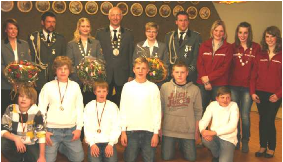
Das Königshaus 2011